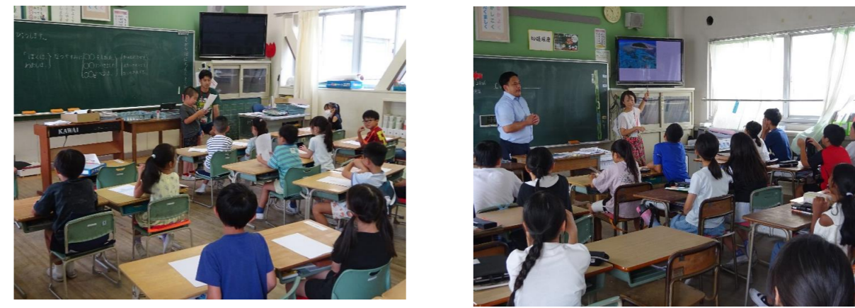
元気に登校できて、よかったです。みんな充実した夏休みを過ごしたようでした。