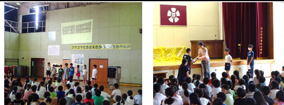
生活委員の児童が安全な登下校や下駄箱の靴揃えなどについて発表しました。 児童会の取組「はらまっち にこにこだいさくせん！」の表彰も行いました。