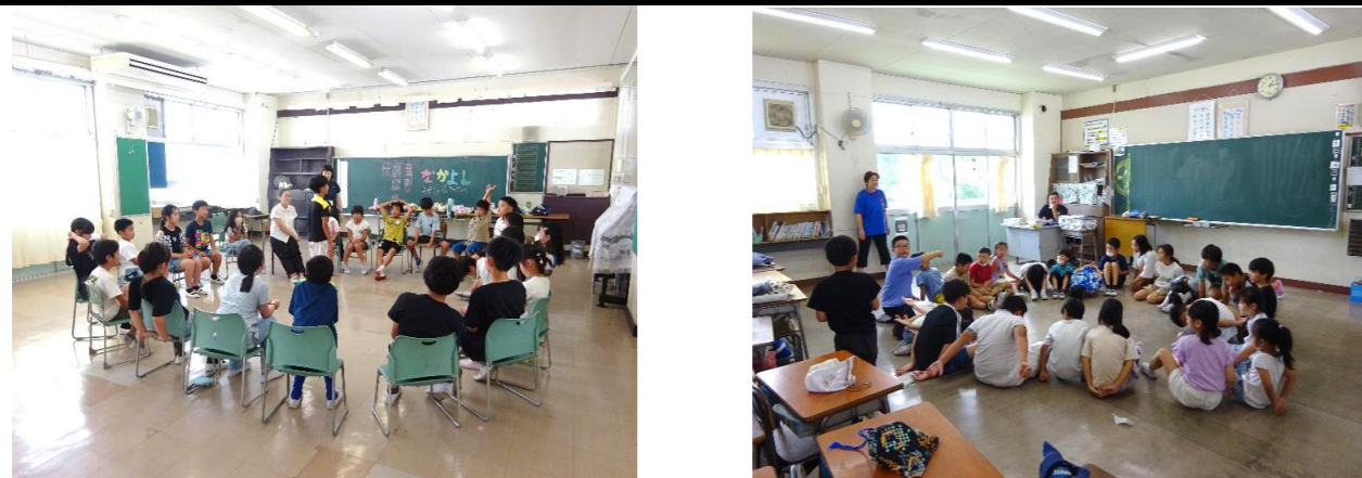
たてわりグループで室内レクを楽しみました。