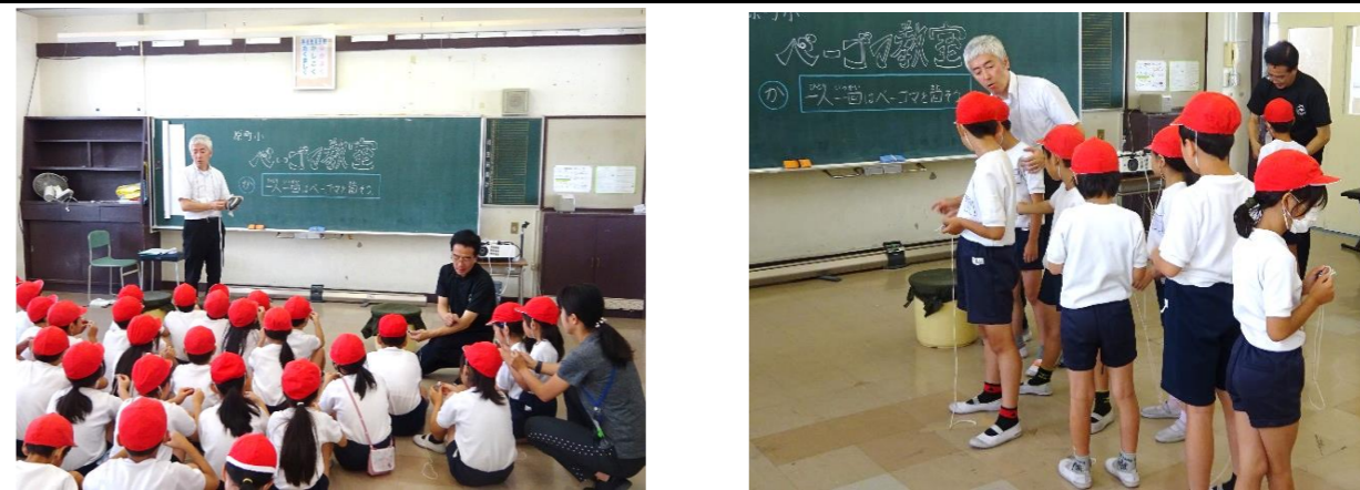
ベーゴマの先生を2名お招きして、練習しました。