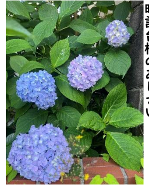
時計台横のあじさい

我々職員も上記のことを意識し、達成への過程と具体的な行動をほめるようにしていきます。ほめることで笑顔になる子供たちを見ると、ほめる側としても嬉しいものですね。安心してやる気になれる子供たちが集まる原町小学校となるように学校、家庭、地域でほめて育てたいと思います。ご協力をよろしくお願いいたします。